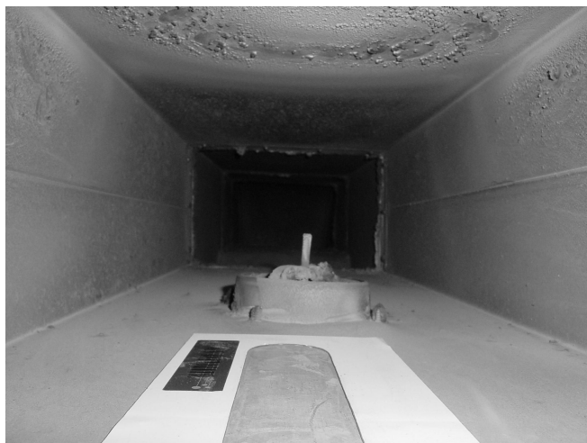
Abb. 4: Prüfschablone (magnetisch haftend) mit einer Testfläche von 100 cm 2 für das Win-Test Saugverfahren.

Vertikale Lüftungskanäle sind nicht zu beproben, weil dort kaum Schmutzanlagerungen in einer nennenswerten Form auftreten. Ausgenommen von diesen Anforderungen sind Küchenabluftkanäle. Fett- und Ölsammlungen stellen eine nicht unerhebliche Brandlast dar. Lüftungssysteme dieser Art sind deshalb aus anderen Gesichtspunkten periodisch zu kontrollieren und bereits bei geringen Verschmutzungen fachgerecht zu reinigen.